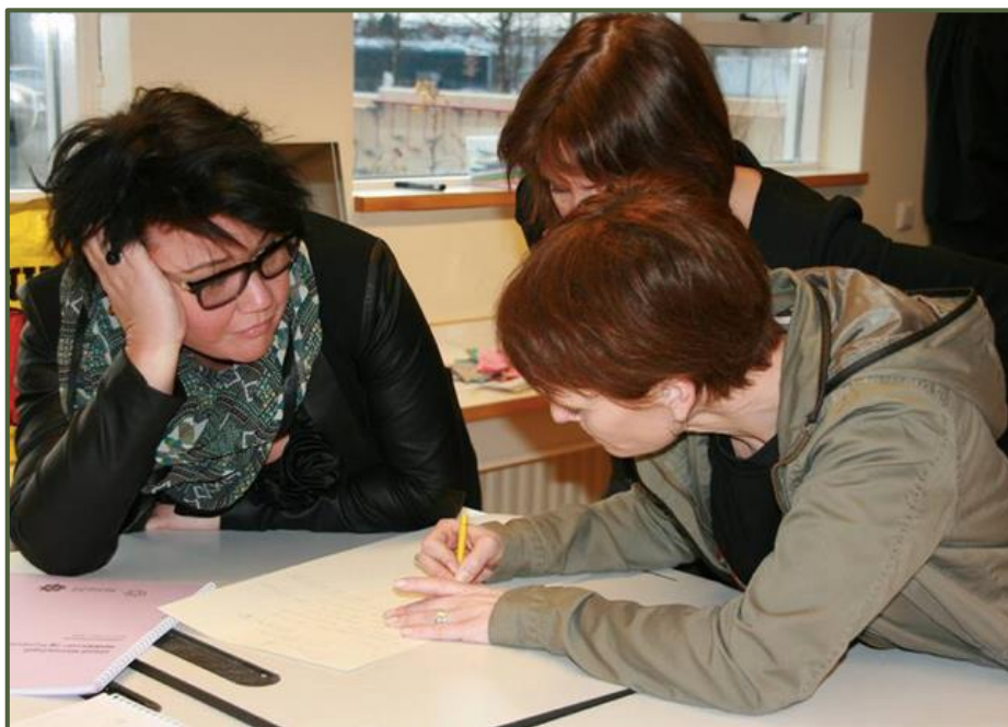
List- og verkgreinakennarar vinna að þróunarverkefninu frá frumkvæði til framkvæmdar