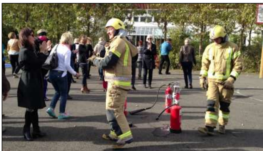
Aðstoðarskólalastjóri þakkar slökkviliðsmönnum fyrir kennslu á eldvarnarnámskeiði starfsmanna í september 2013.